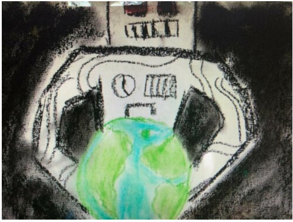
Un robot rêve